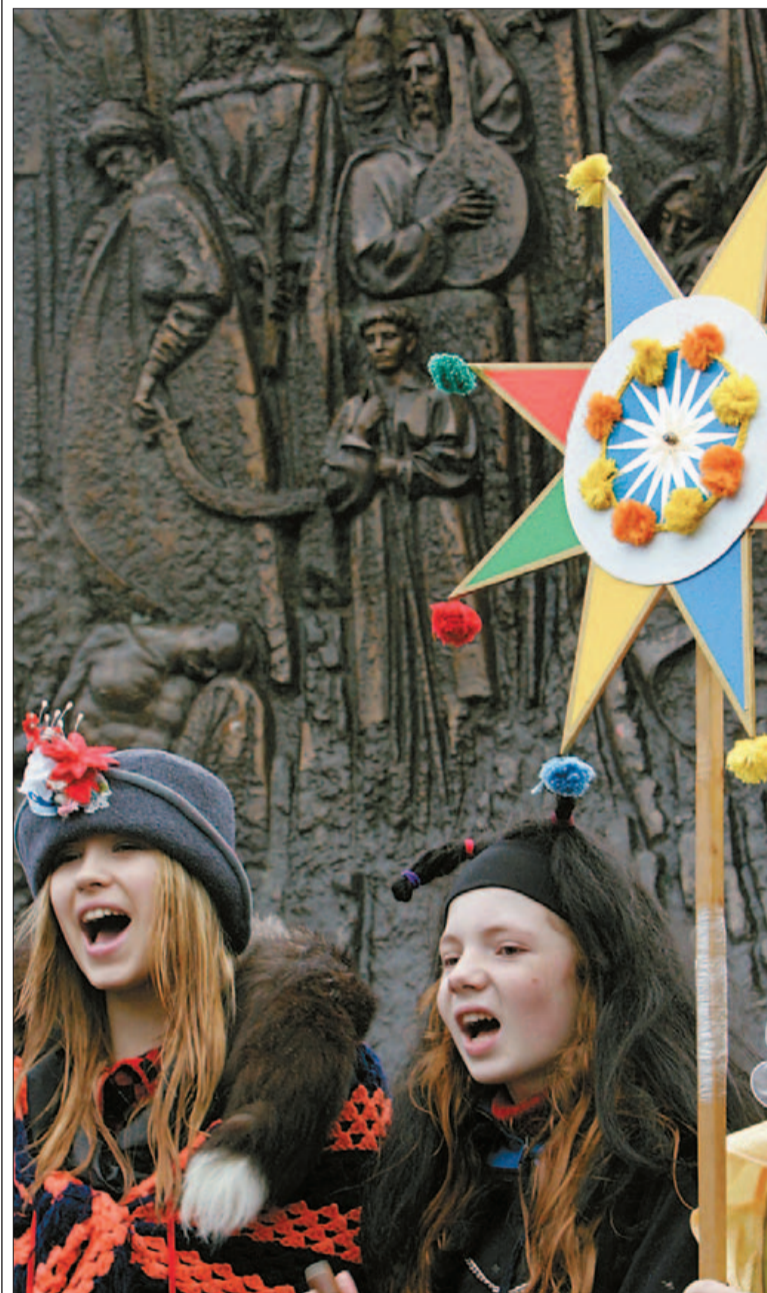
Деца в народни одежди пеят коледни песни в западния украински град Лвув. Православните християни в Русия, Украйна, Сърбия, Македония празнуваха вчера Рождество Христово